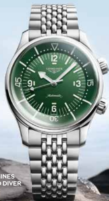
LONGINES LEGEND DIVER